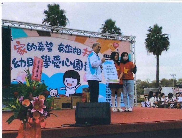
代表全體攤位受獎