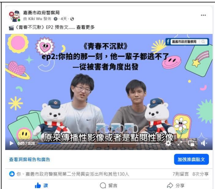
活動名稱：報嘉音4.0—青春不沉默第二集