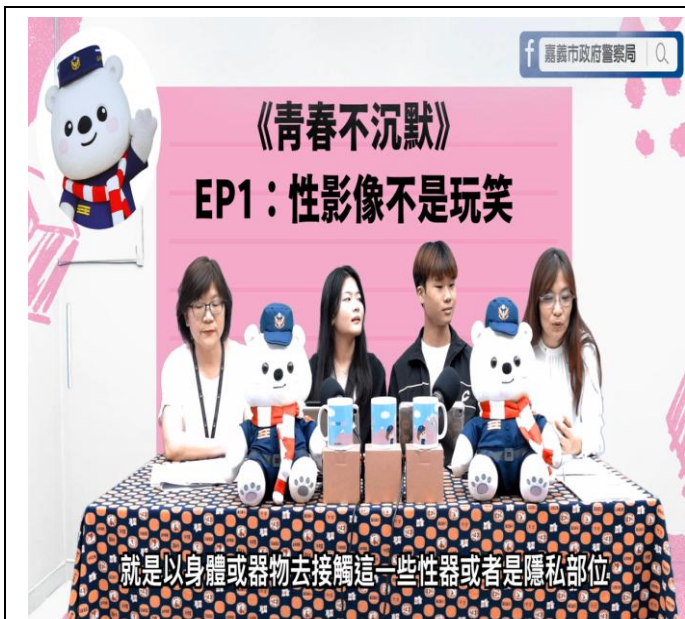
活動名稱：報嘉音4.0—青春不沉默第一集