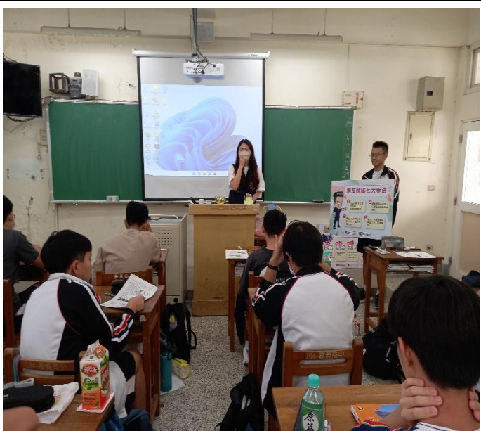
活動名稱：114年10月13日嘉義高中婦幼安全宣導

(五)為加強新住民人身安全預防宣導，警察局官方臉書發布多國語言防詐、防扒竊及防制人口販運宣導短影片1則，提升新住民預防犯罪意識，共計1.5萬次觀看次數、按讚