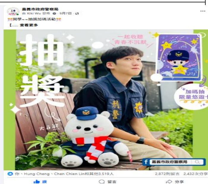
活動名稱：報嘉音4.0—青春不沉默抽獎活動