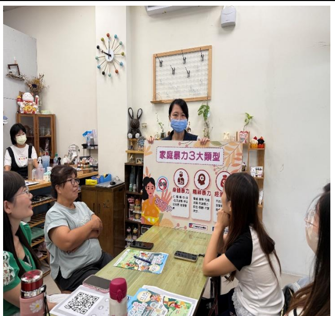
活動名稱：114年11月6日家庭暴力防治宣導