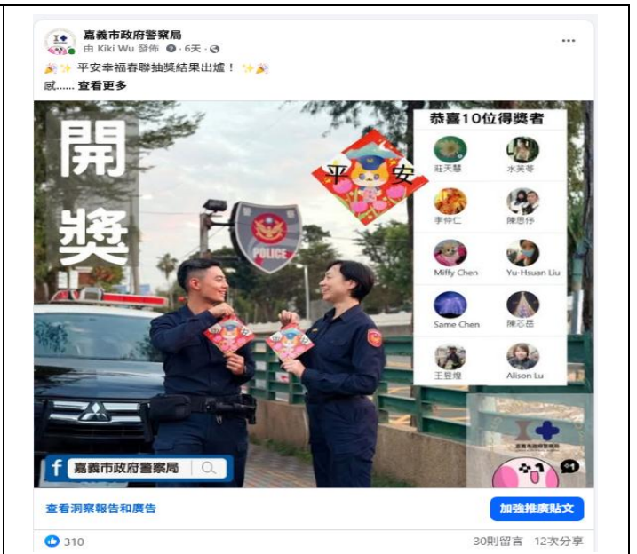
活動名稱：114年12月響應320+1嘉義市城市博覽會辦理開獎活動