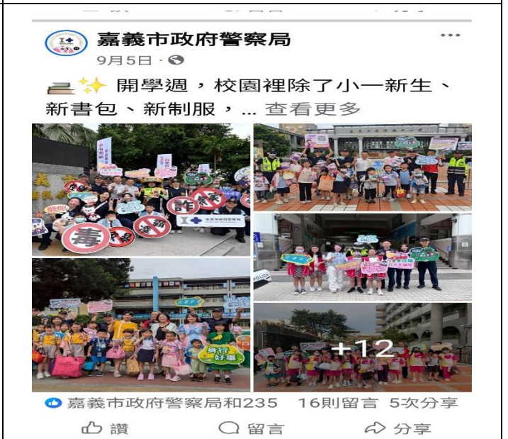
活動名稱：114年9月開學週婦幼安全宣導