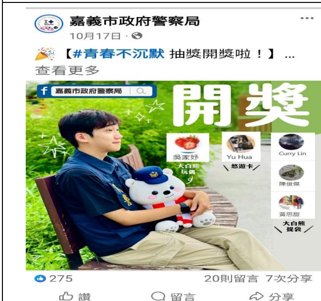
活動名稱：114年10日青春不沉默抽獎開獎