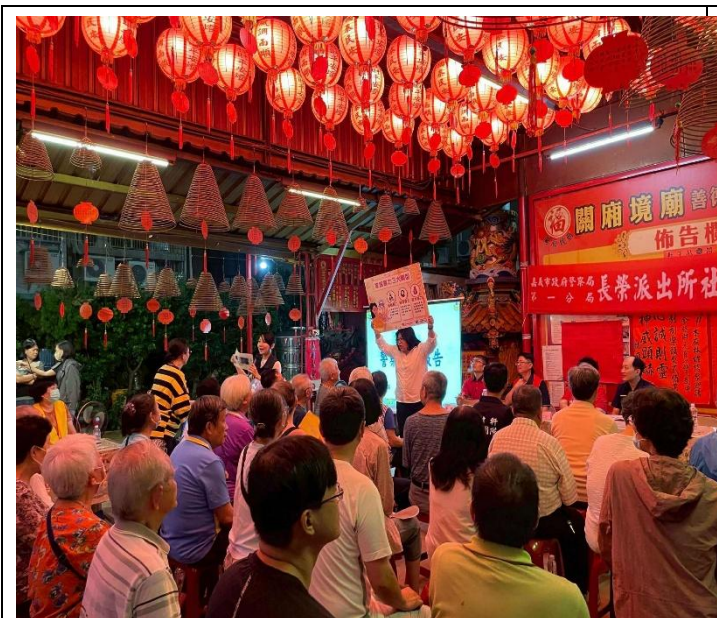
活動名稱：114年9月10日長榮派出所—文化里社區治安會議