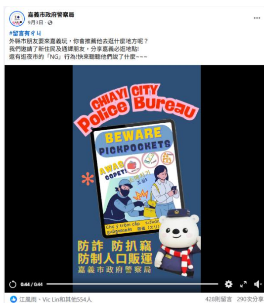
活動名稱：臉書貼文