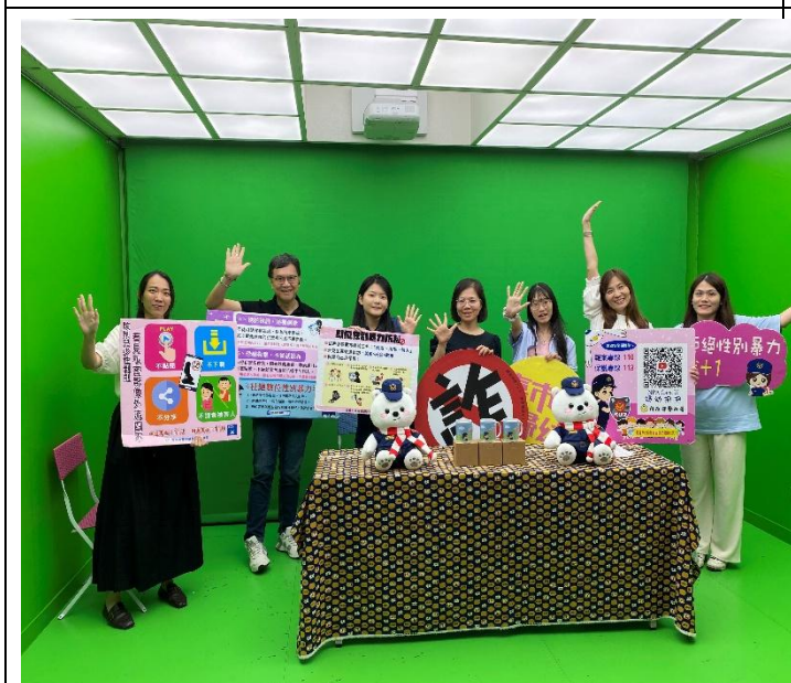
活動名稱：報嘉音4.0—青春不沉默錄製活動