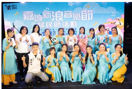
2025 嘉城新浪音樂節暨移民節活動人潮及表演者照片