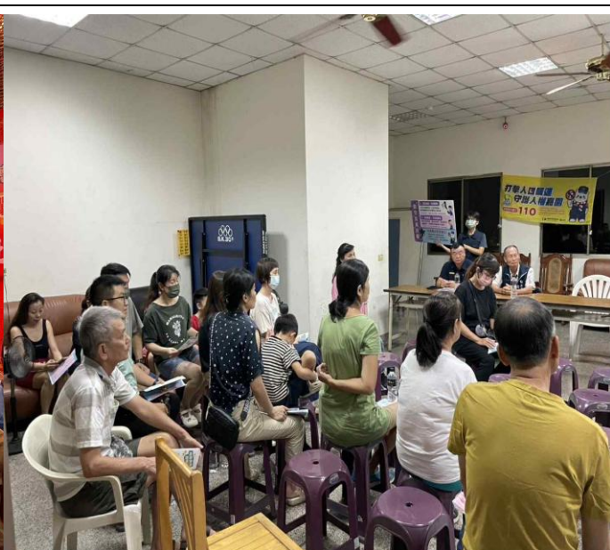
活動名稱：114年10月2日北興派出所—北榮里社區治安會議