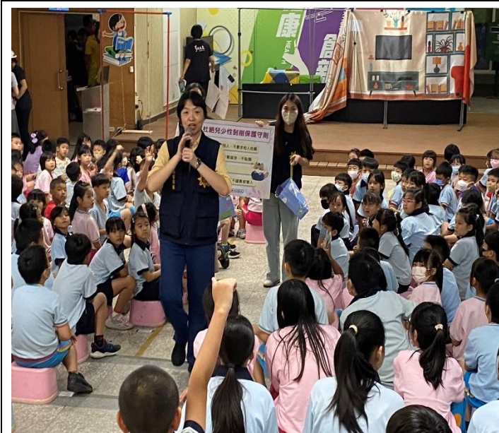
活動名稱：114年9月30日北園國小婦幼安全宣導