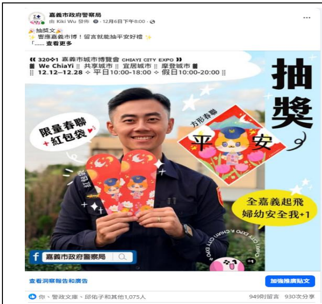
活動名稱：114年12月響應320+1嘉義市城市博覽會辦理抽獎活動