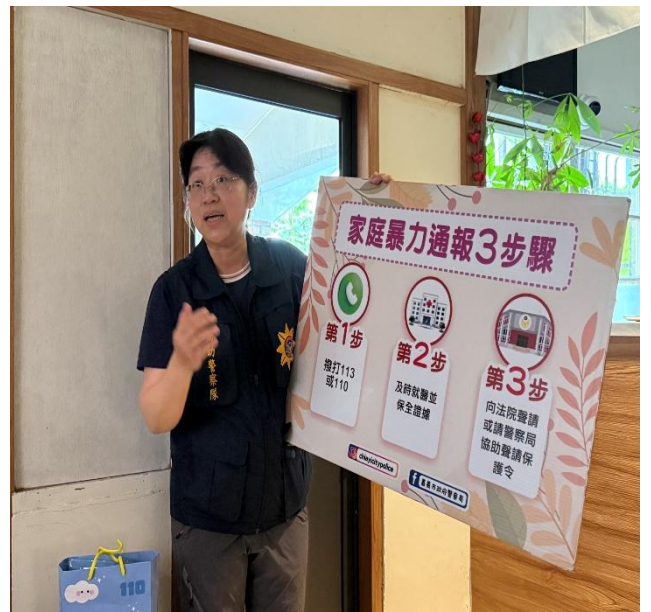
活動名稱：114年9月7日家庭暴力防治宣導