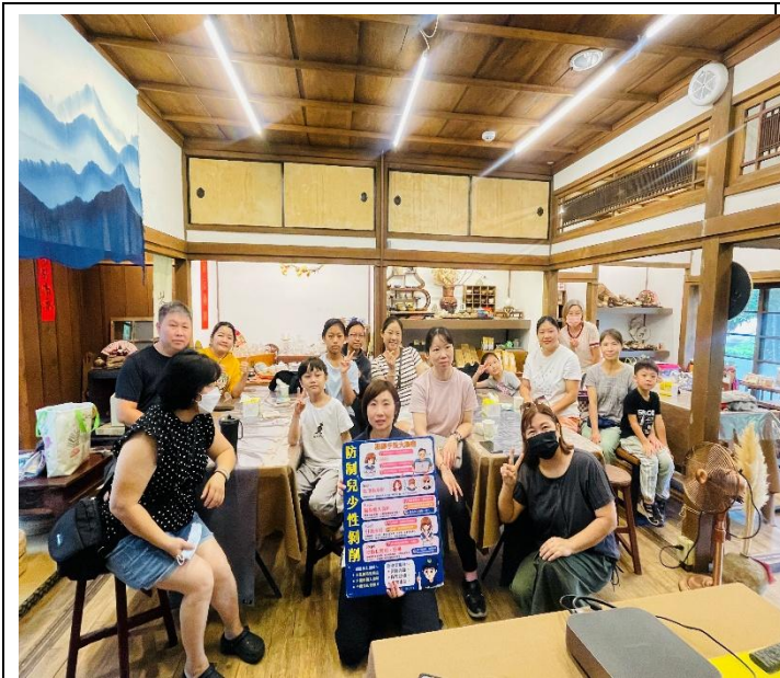
活動名稱：114年7月26日兒少性剝削防制宣導