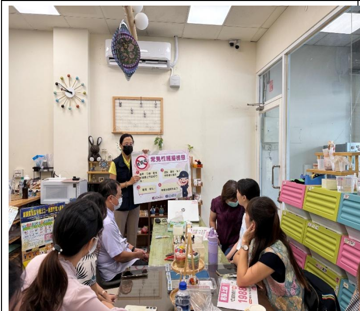
活動名稱：114年11月4日性騷擾防治宣導