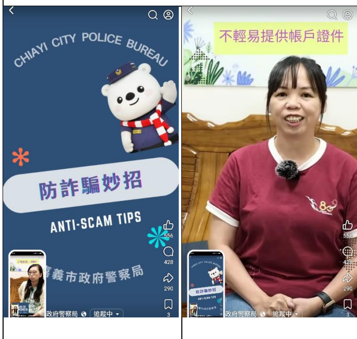
活動名稱：影片截圖—防詐騙