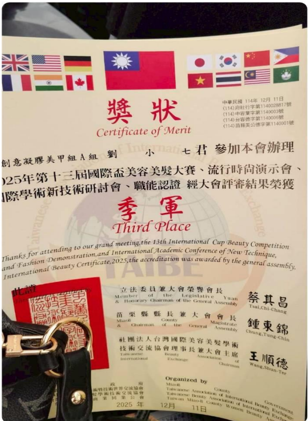
內容：國際盃美容美髮大賽