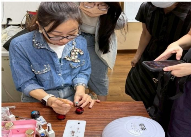
內容：上課訓練期間