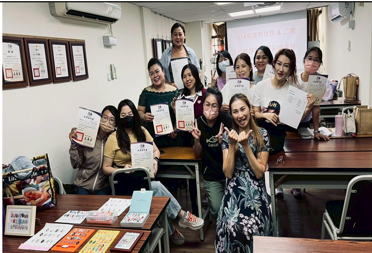
日期：114 年 10 月 20 日