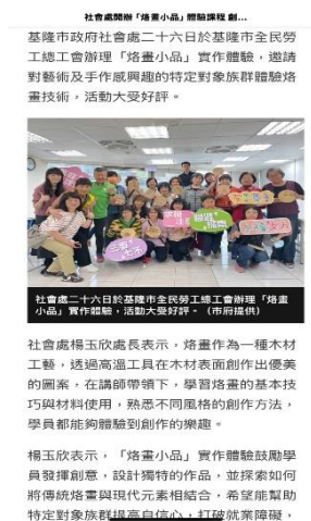
圖 熔畫小品課程新聞稿