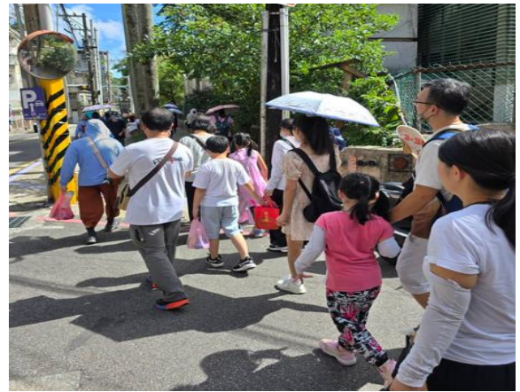
圖 新住民家庭挑戰營—走讀活動