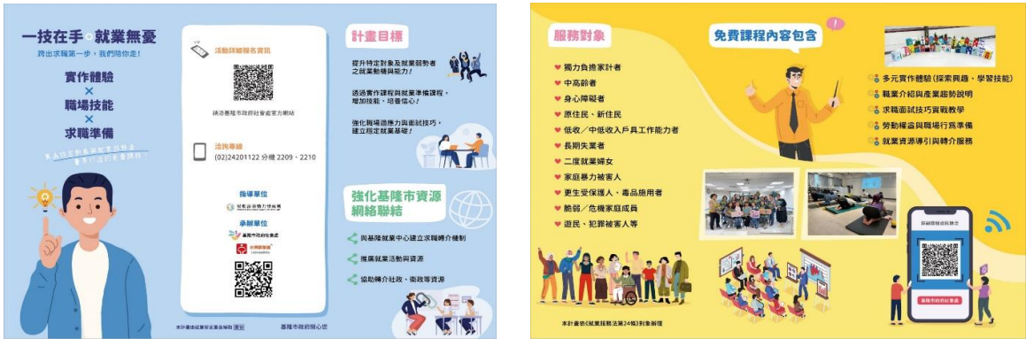
圖 摺頁 DM 宣傳