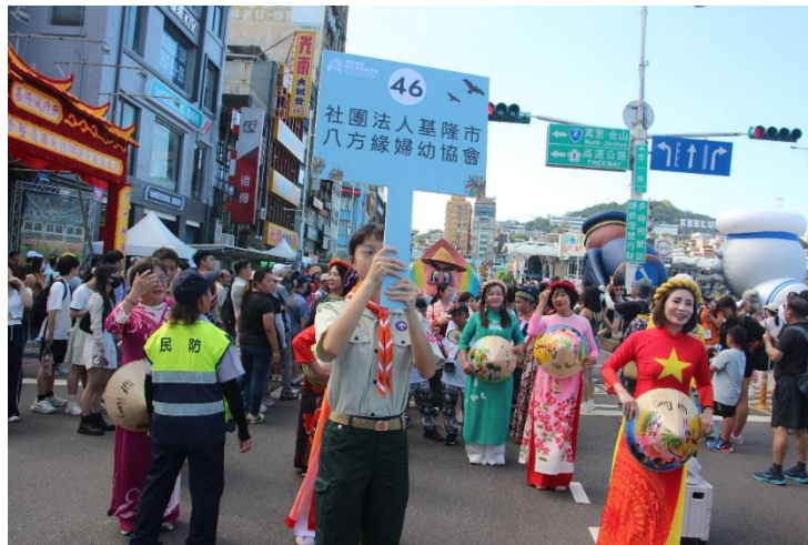
圖 基隆海洋嘉年華：多元族群遊行同樂