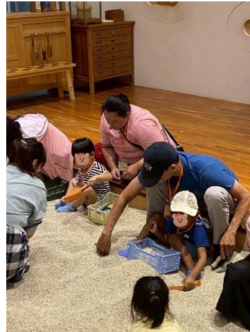
圖 透過活動，支持幼兒學習與發展