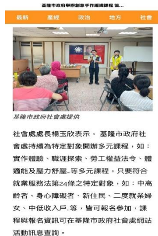
圖 手作編織課程新聞稿