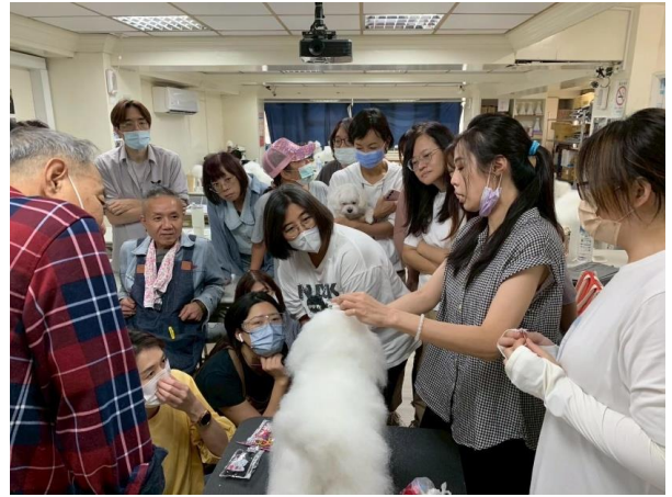
圖 寵物美容專業職能課程