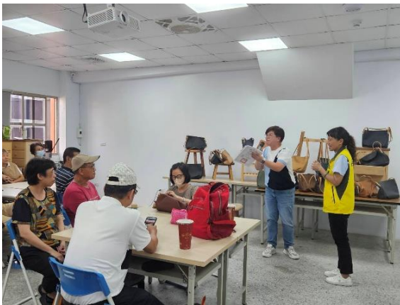
圖 創意木作與多媒材應用課程

基隆市政府社會處將持續關注產業趨勢與民眾需求，推動更多具實務應用性相關職業訓練課程，協助不同族群提升職能、穩定就業。另提醒具就業或轉職需求的市民朋友，均可關注基隆市政府社會處網站或電洽了解最新訓練資訊，共同為基隆打造更多元、包容且永續的就業環境。