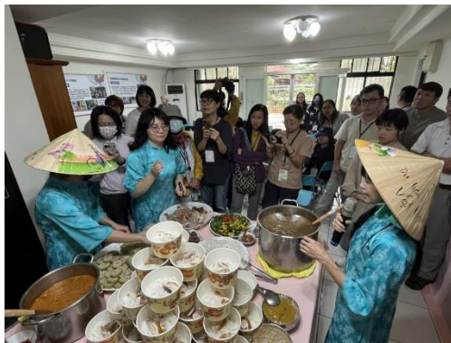
圖 相遇之旅：新住民 x 原住民族文化體驗