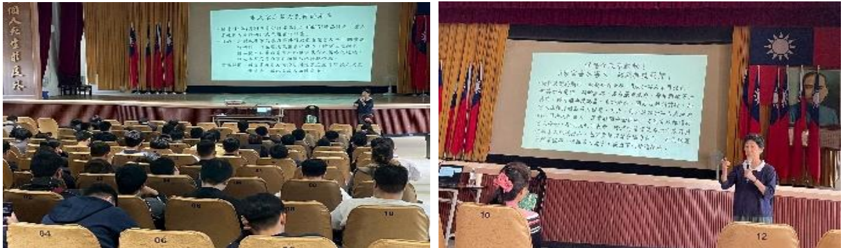
圖 婦幼安全工作專業人員教育訓練