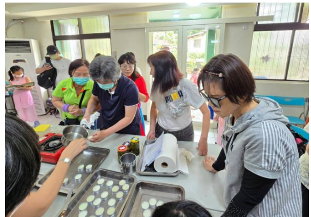
圖 新住民幸福家庭講座—香草精油 DIY