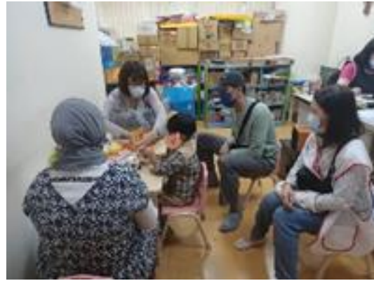
圖 連結醫療與教育資源，協助家長理解孩子發展需求