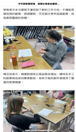
圖 金屬線珠寶課程新聞稿