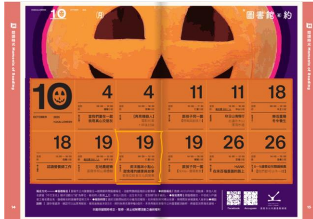
圖 基隆市文化觀光局-文化開傳10