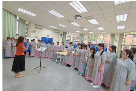
穿著越南代表服飾，練習越南在地民謠表演