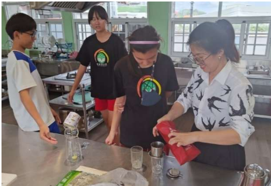
解說越南食物特色，製作越南滴咖啡