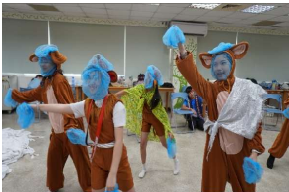
「耀星班戲劇坊」培訓課程情形

(二)照片或相關資訊網址： https://www.kmseh.gov.tw/home.php 。