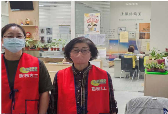
提供新住民法律諮詢資料服務窗口，並提供免費法律諮詢服務