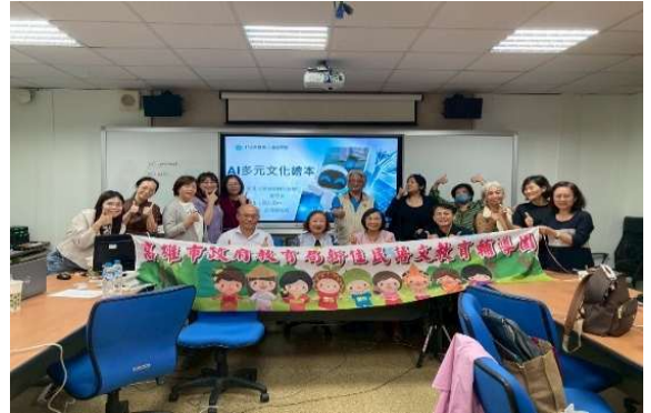
邀請專家學者舉辦講座