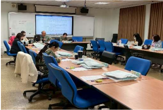
定期召開輔導團團務會議