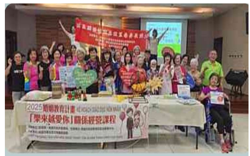
「樂來越愛你」關係經營課程