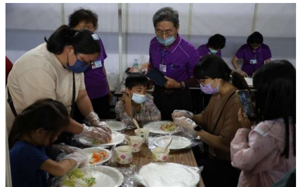
親子共學玩創藝~越南美食-春捲