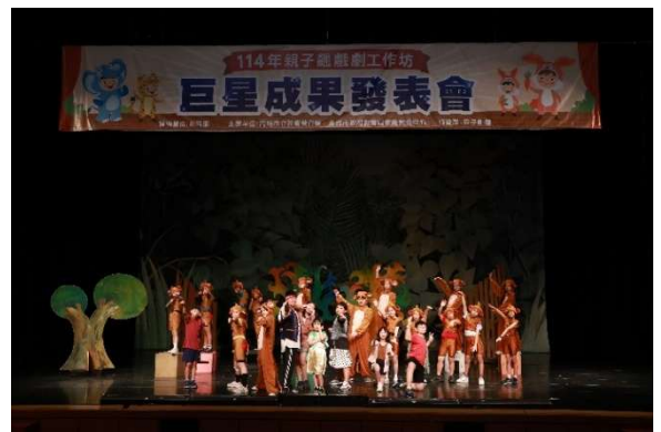
「耀星班戲劇坊」成果發表會演出