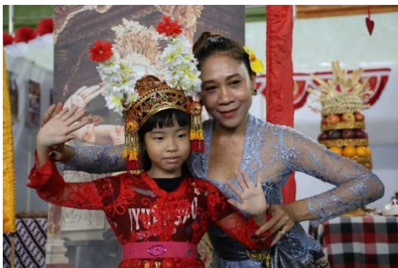
異國時光·峇里島文化體驗活動