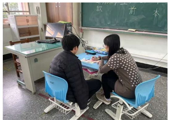
協助跨國銜轉學生華語學習