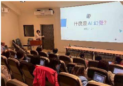
教學支援老師增能研習-Google Gemini AI 認證