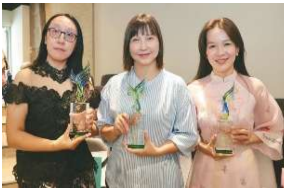
第二屆雄新獎得主合影