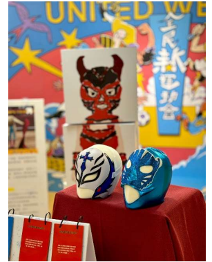
辦理多元文化主題展，以「全民新運動會」為主軸，介紹新住民國家的運動特色