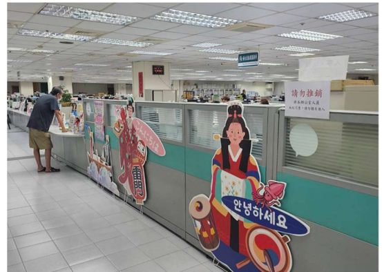
提供新住民法律諮詢資料服務窗口，並提供免費法律諮詢服務