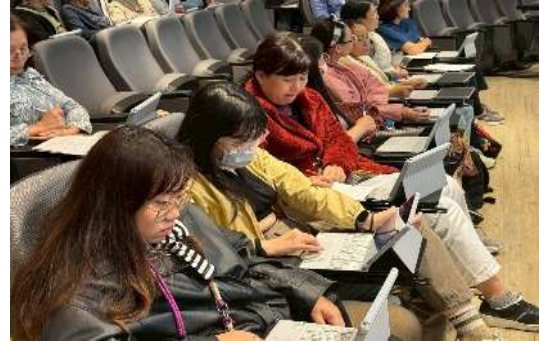
教學支援老師增能研習 Gemini AI 認證