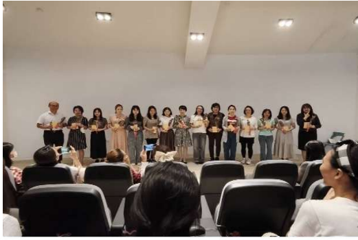
教學支援老師回流班