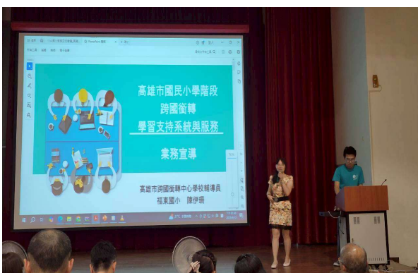
教務主任會議說明跨國銜轉服務