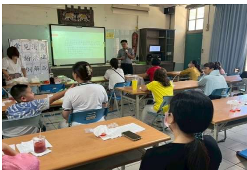
新住民學習中心活動-常見消費糾紛 法律案例解說-從消費者保護法談起