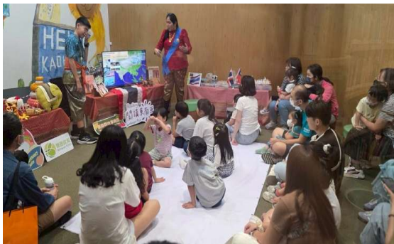
「雄新獎」得主娜緹雅老師分享泰國故事繪本，並結合文化介紹、泰語教學。