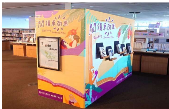
透過閱讀與文化探索，提高大眾對東南亞歷史與文化的興趣，並促進跨文化理解。