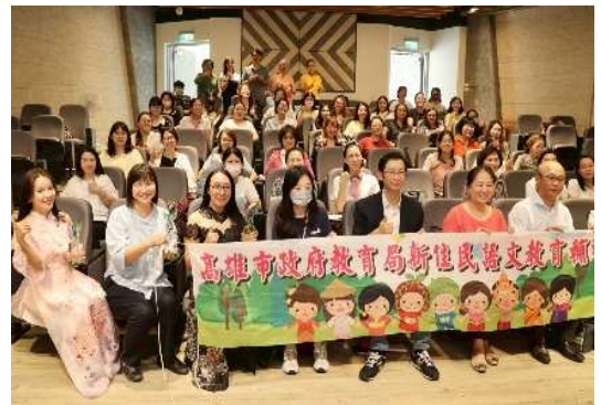
新住民教學支援老師職前研習