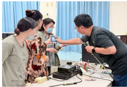
新住民學習中心活動-資訊媒體素養-