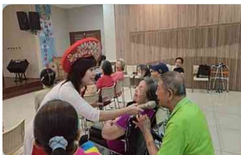
越南LO TO 樂透 -唱進你心-親職教育計畫