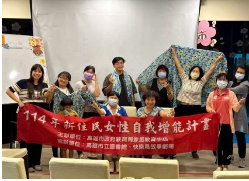
新住民女性自我增能計畫