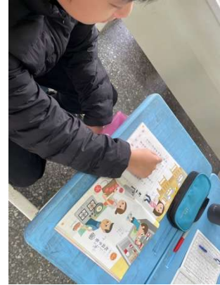
中文與越南語對應教學