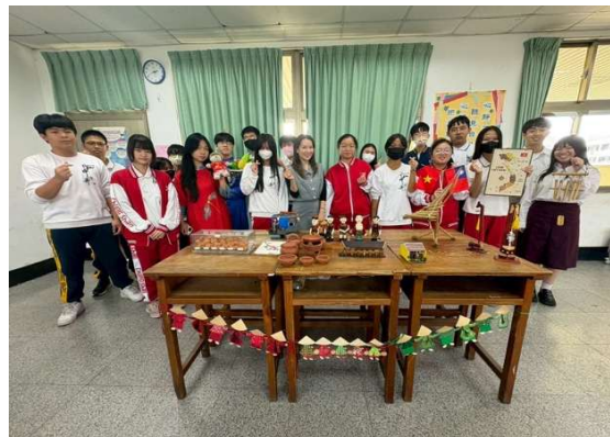
多元文化體驗活動