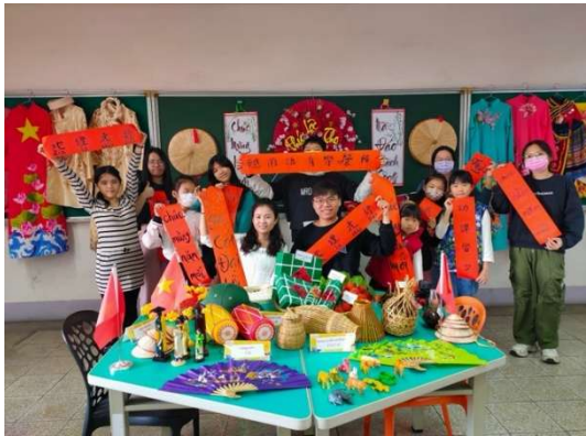
辦理多元文化育樂營活動