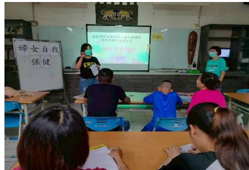
新住民學習中心活動-新住民婦女健康 照護學園