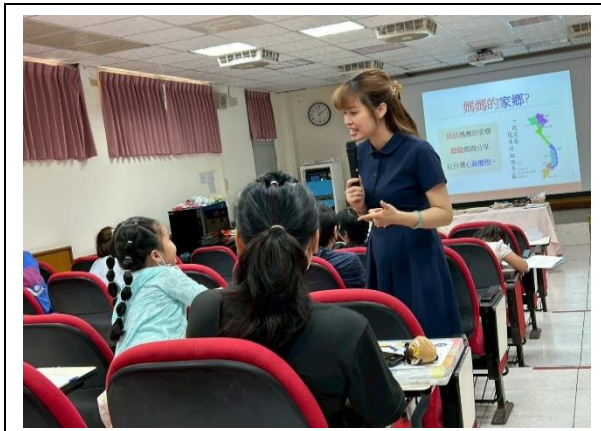
親子共學—愛的加油站

具體措施三：辦理新住民之成人基本教育研習班，以培養文化適應及生活所需之語文能力，並進一步作為進入各種學習管道，取得正式學歷之基礎。