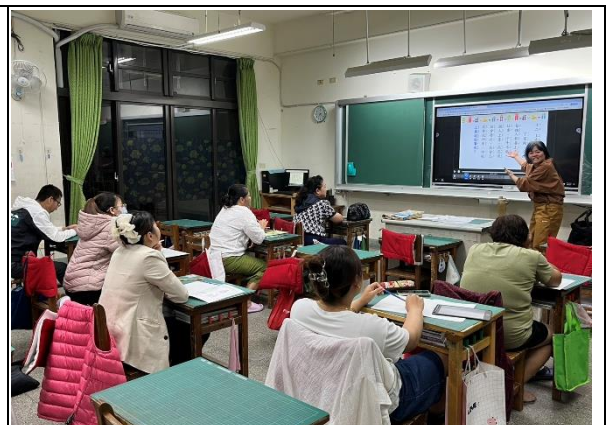
五甲國小新住民教育班 —認識語詞