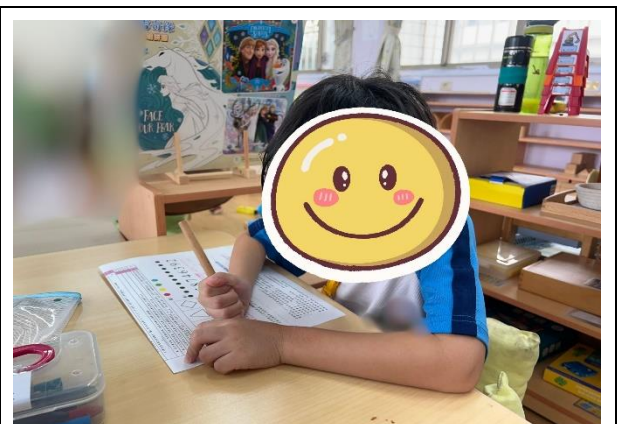
填寫兒童發展檢核表