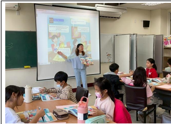
新市國小—介紹越南用語