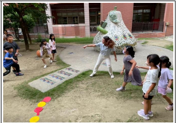
新市國小—體驗越南傳統遊戲