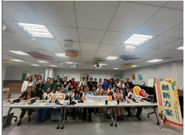
短影音比賽大合照