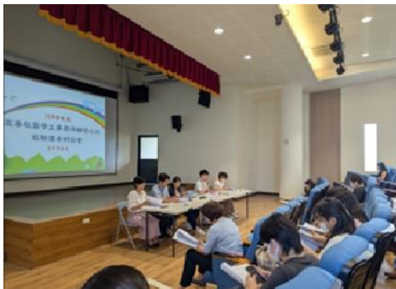
友善校園學輔傳承研習