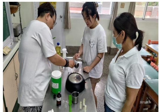
生活適應輔導班 健康教育—天然植萃 DIY