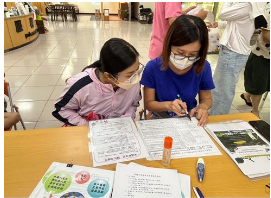
戶所提供國籍歸化、戶籍登記等諮詢服務