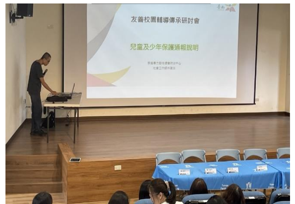
家暴暨性侵防治中心社工師 兒童及少年保護主題宣講