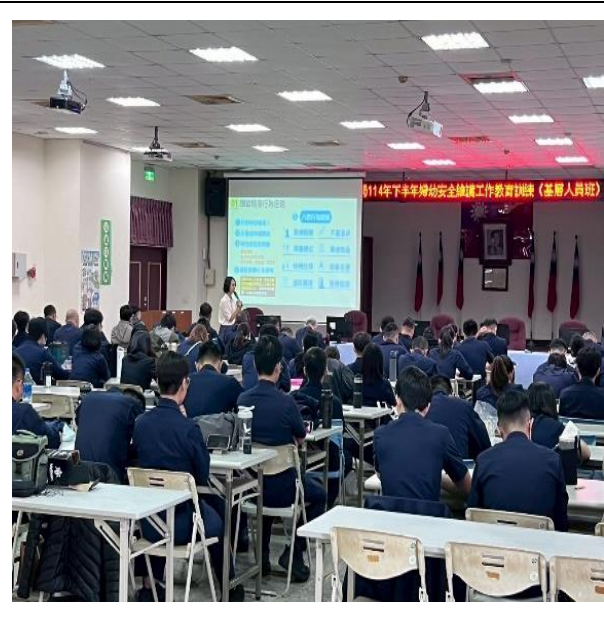
日期： 114年11月21日 課程： 講授「性騷擾及跟蹤騷擾事(案)件處理流程」 講座： 臺南市政府警察局婦幼警察隊警務員潘品如