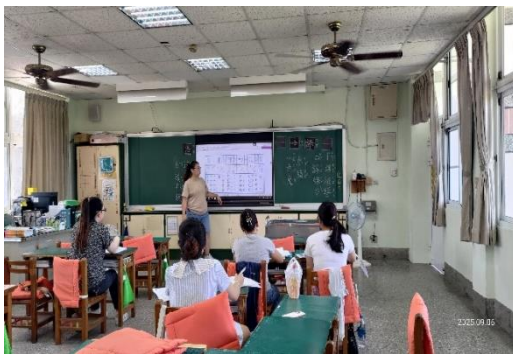
生活適應輔導班 語言學習—識字課程