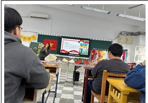
六甲國中—越南文化介紹