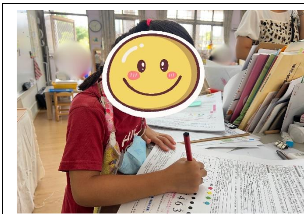
填寫兒童發展檢核表