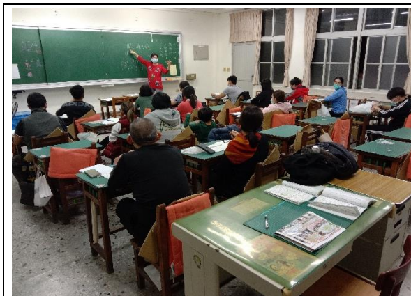
安順國小新住民教育班 —生字教學