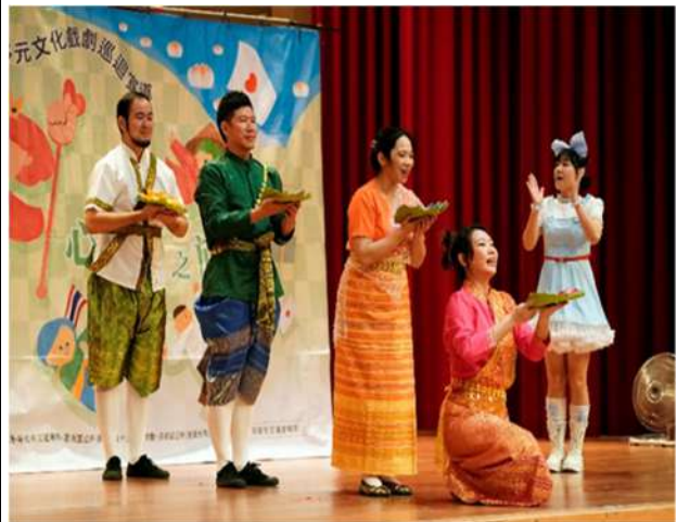
透過戲劇演出讓新北市民眾及學生了解多元文化意涵。