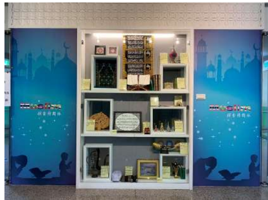
中和分館辦理穆斯林文物展(新北市政府文化局)