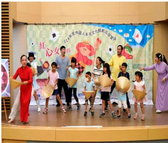
透過戲劇演出讓新北市民眾及學生了解多元文化意涵。(新北市政府勞工局)