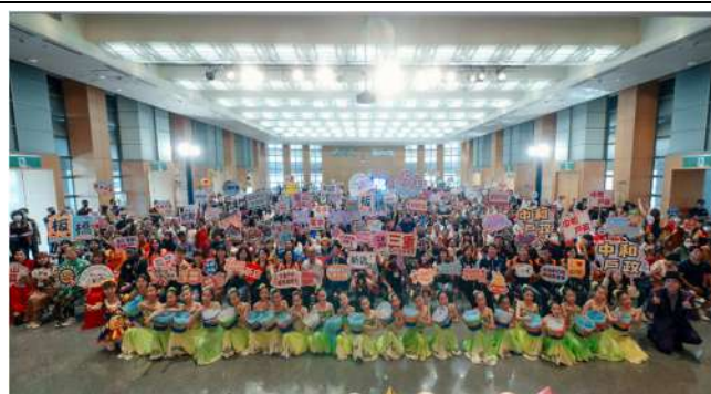
辦理新住民生活適應輔導班聯合結業典禮及多元文化交流日。(新北市政府民政局)