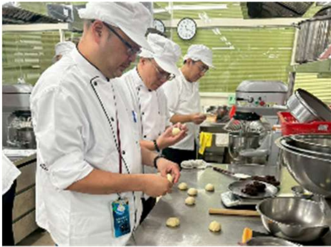
烘焙食品(麵包類)丙級證照輔導班上課情形(新北市政府職訓中心)