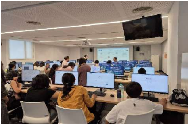
總館辦理新住民金融公益講座(新北市政府文化局)