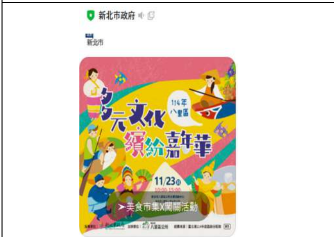
LINE 推播「多元文化繽紛嘉年華」活動資訊。