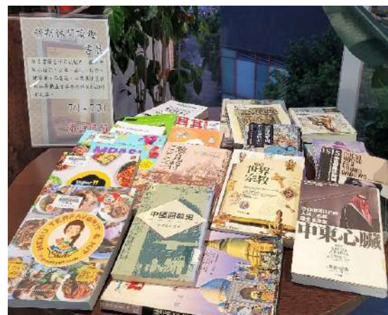
樹林分館辦理「穆斯林閱讀趣」主題書展