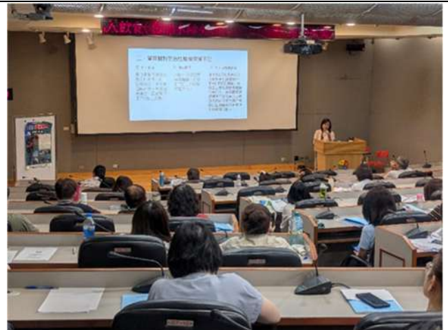
邀請專家學者宣導就業服務法及性別平等工作法規定(新北市政府勞工局)