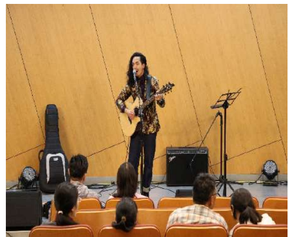
新北市立十三行博物館辦理 2025「國際移民日」音樂會。