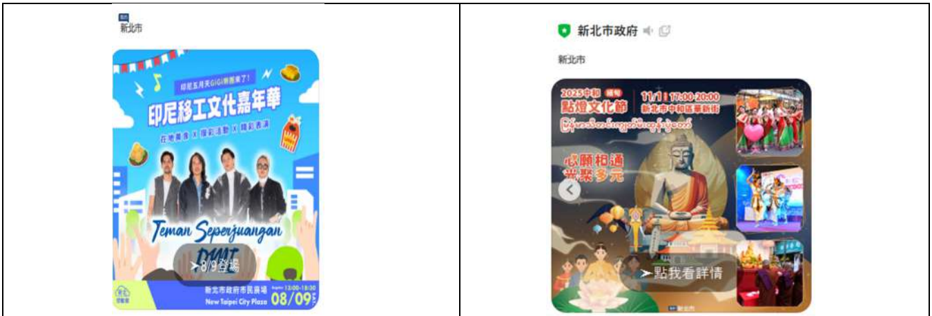
LINE 推播「印尼移工文化嘉年華」活動資訊。