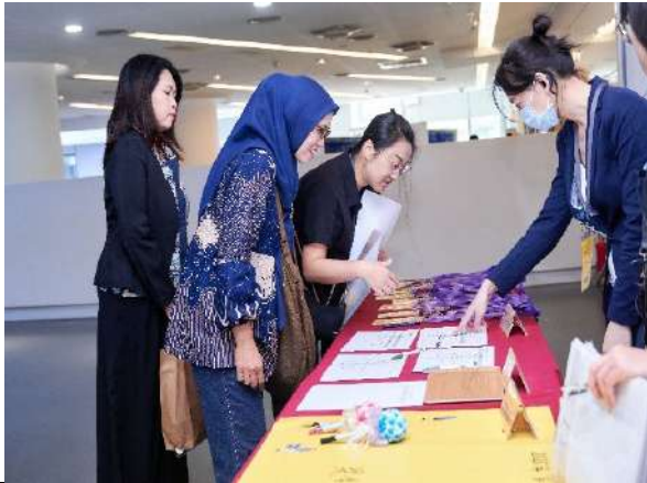
本屆新北市文學獎「新住民圖文創作組」外籍得獎者出席頒獎典禮。