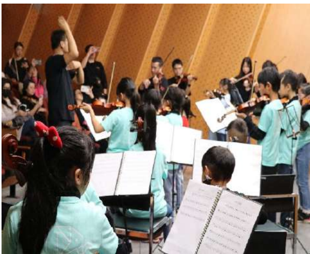
新北市立十三行博物館辦理 2025「國際移民日」音樂會。(新北市政府文化局)