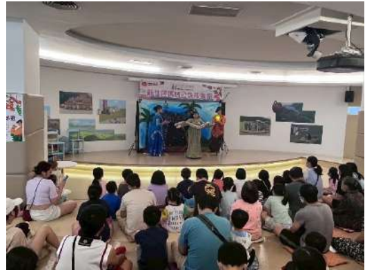
新北市立圖書館總館新住民媽媽公益故事劇《印尼故事劇-神秘蛇郎君》(新北市政府文化局)