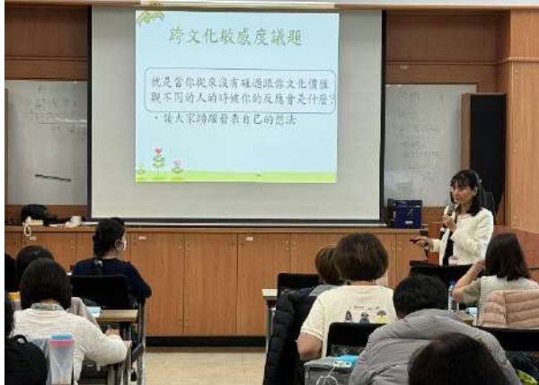
新住民生育保健通譯員初階教育訓練，講授跨文化敏感度議題介紹(新北市政府衛生局)