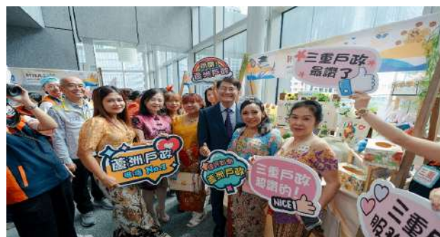
辦理新住民生活適應輔導班聯合結業典禮及多元文化交流日。(新北市政府民政局)