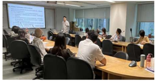
通譯人員在職訓練(新北市政府勞工局)