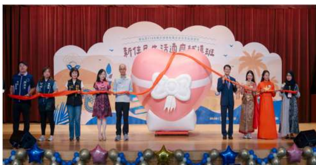
辦理新住民生活適應輔導班聯合結業典禮及多元文化交流日。(新北市政府民政局)