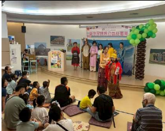
新北市立圖書館總館新住民媽媽公益故事劇《原創故事劇-美味大冒險》(新北市政府文化局)