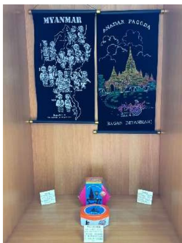
中和分館辦理緬甸風情文物展(新北市政府文化局)