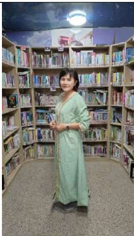
中和分館辦理多國服飾裝扮打卡(國服體驗)活動(新北市政府文化局)