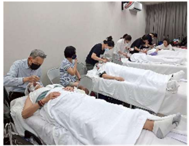
芳香美學與美膚保養全方位培訓班(新北市政府職訓中心)