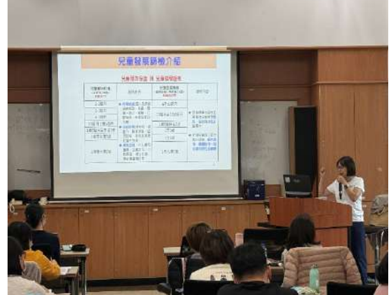
新住民生育保健通譯員初階教育訓練，講授兒童發展篩檢的重要性