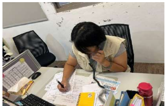
提供中、粵、越、英、印、泰、菲、緬甸及柬埔寨語等 9 語諮詢服務。(新北市政府社會局)