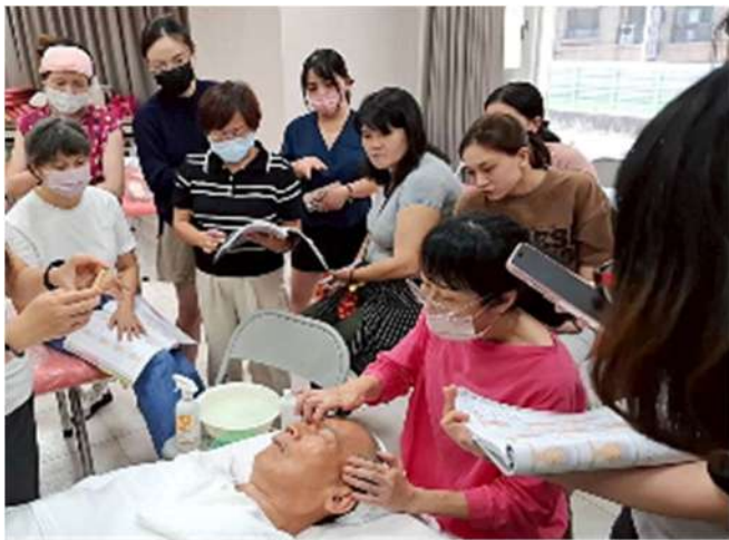
芳香美學與美膚保養全方位培訓班(新北市政府職訓中心)