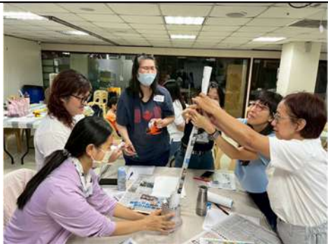
藉由專業講師帶領，促進通譯人員間的凝聚力與自信，以提升其服務效能。