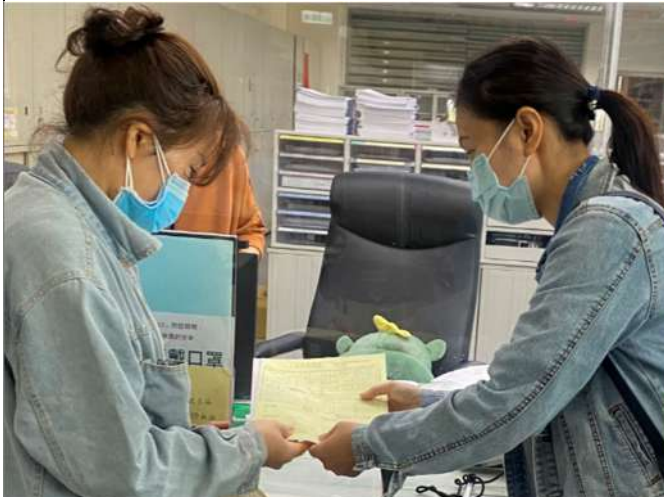
新住民通譯員宣傳加入全民健康保險之資訊予新住民市民