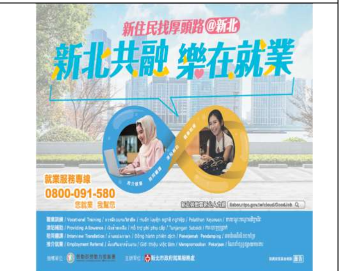
於臺北捷運系統刊登「新住民就業求職新動力服務計畫」宣導燈箱。(新北市政府新聞局)