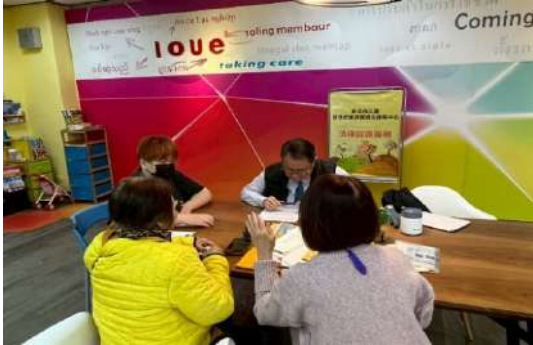
提供法律諮詢服務，為新住民解答法律上的議題。(新北市政府社會局)