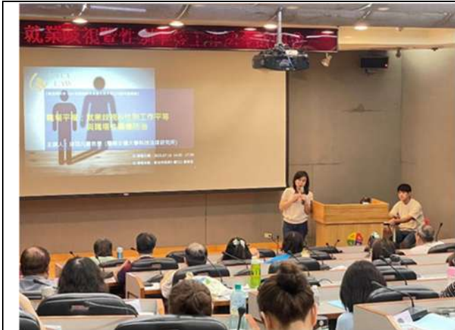
邀請專家學者宣導就業服務法及性別平等工作法規定(新北市政府勞工局)