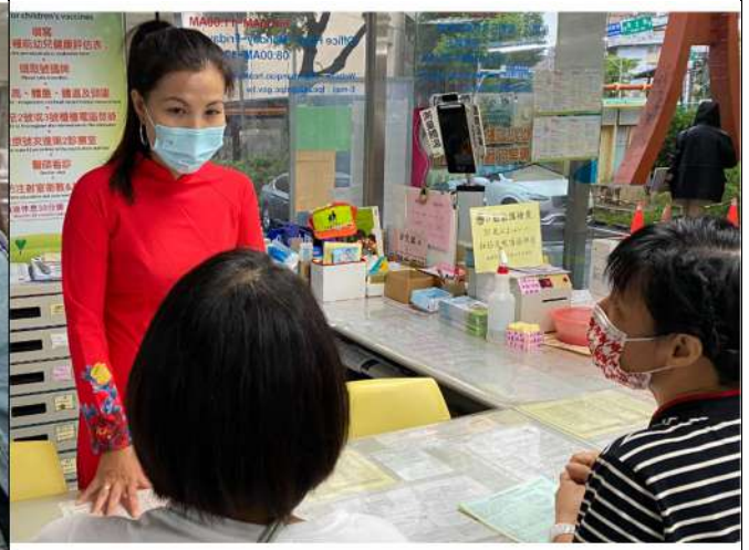
新住民通譯員宣傳加入全民健康保險之資訊予新住民市民(新北市政府衛生局)