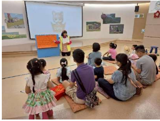
新北市立圖書館總館印尼媽媽分享家鄉童(新北市政府文化局)