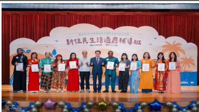
辦理新住民生活適應輔導班聯合結業典禮及多元文化交流日。(新北市政府民政局)