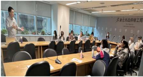
通譯人員在職訓練(新北市政府勞工局)