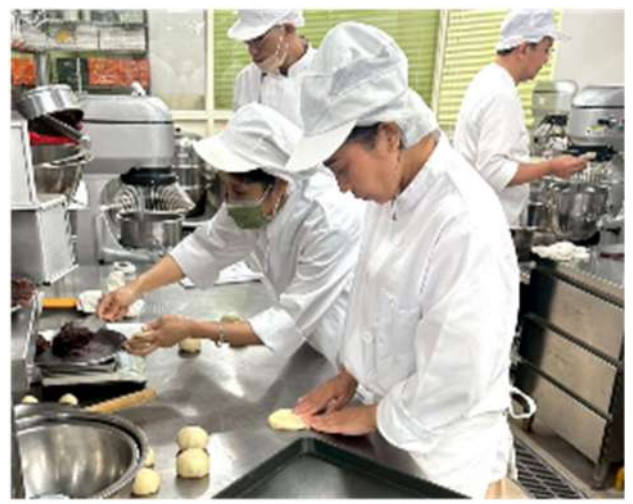
烘焙食品(麵包類)丙級證照輔導班上課情形(新北市政府職訓中心)