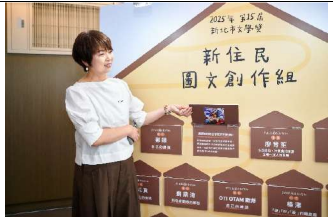
本屆新北市文學獎得獎作品展，呈現 13 件得獎作品。