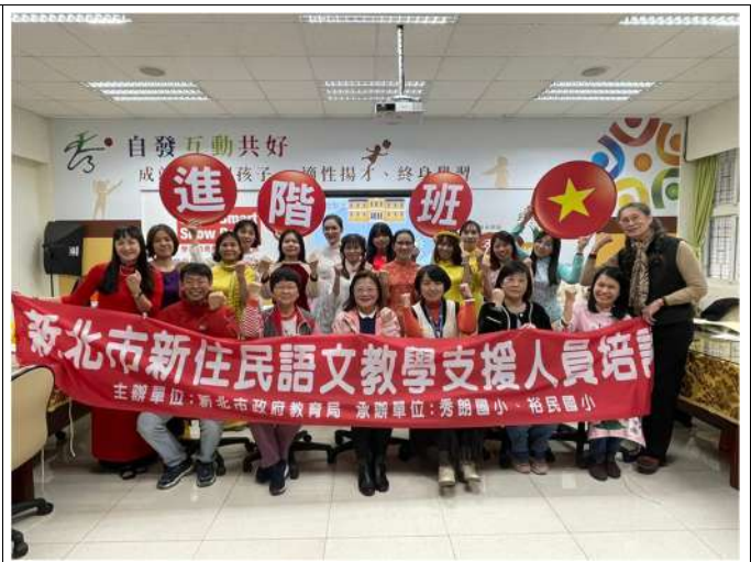
新住民語教學支援老師進階培訓，培育專業教學人才(新北市政府教育局)