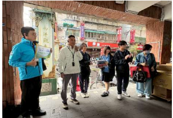
中和分館辦理走讀華新街活動(新北市政府文化局)