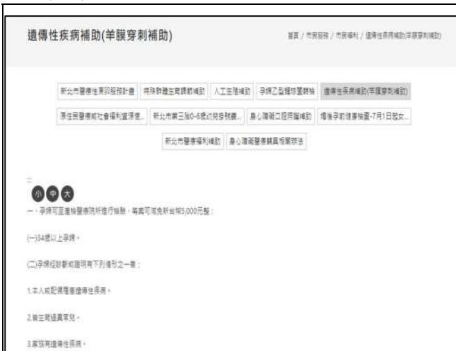
1. 於本局官網宣導遺傳性疾病補助資訊 2. 網址： https://reurl.cc/8vxEeR (新北市政府衛生局)