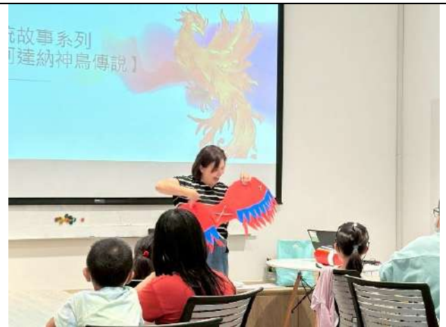
泰山分館辦理菲律賓傳統故事《阿達納神鳥傳說》繪本發表會(新北市政府文化局)