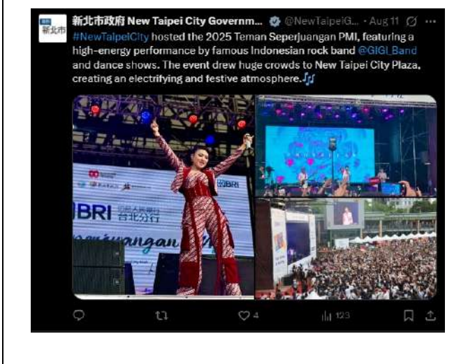
X(Twitter)發布印尼移工文化嘉年華。