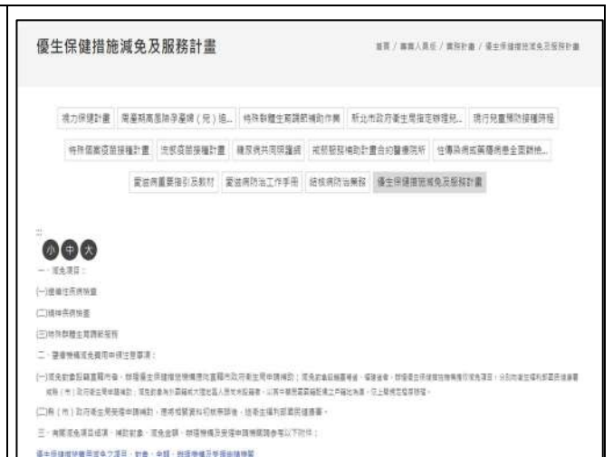
1. 於本局官網宣導優生保健措施減免費資訊 2. 網址： https://reurl.cc/3XqgmR (新北市政府衛生局)