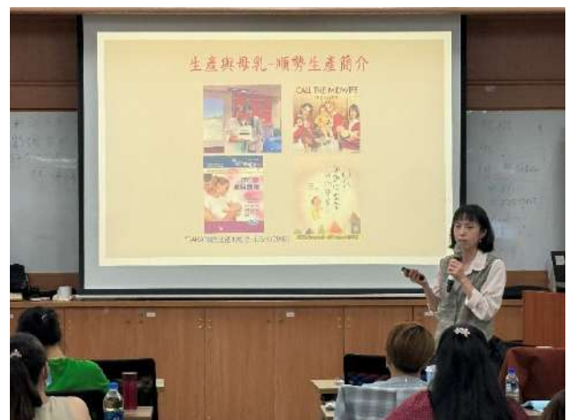
新住民生育保健通譯員進階教育訓練，講授生產與母乳哺餵(新北市政府衛生局)