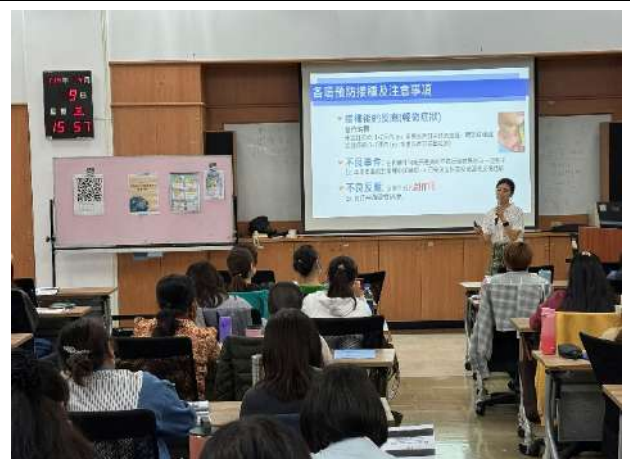
新住民生育保健通譯員進階教育訓練，講授嬰幼兒保健(新北市政府衛生局)