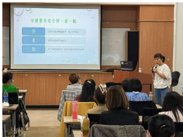
新住民生育保健通譯員進階教育訓練，講授居家安全意識兒童事故傷害防制(新北市政府衛生局)