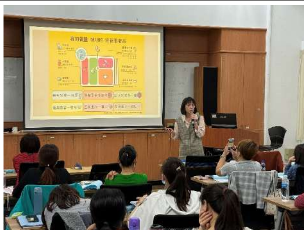
新住民生育保健通譯員進階教育訓練，講授飲食與營養(新北市政府衛生局)