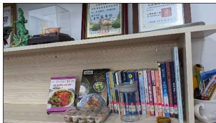
▲閱讀角落-小型巡迴書展