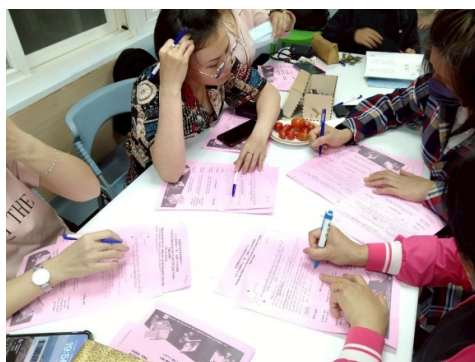
通譯學員進行簡章翻譯練習