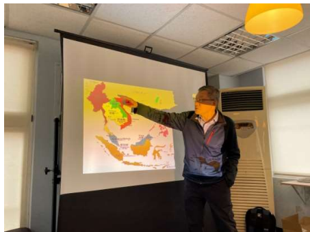
外督師資講授東南亞專業知能