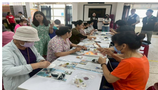
運用澎湖海洋資源，製作貝殼夜燈