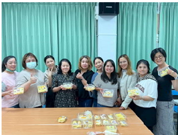
『新』光烘焙趣 活動計畫(第 2 場)～ 成果合照