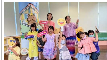
▲現場道具拍照打卡時間