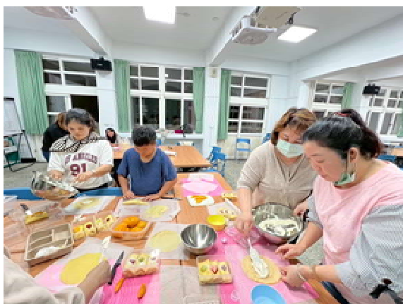
『新』光烘焙趣 活動計畫(第 2 場)～ 學員實際操作