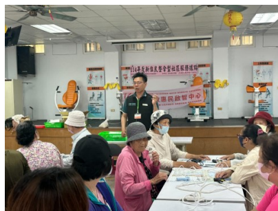
結合西嶼就服台宣導提供就業資訊