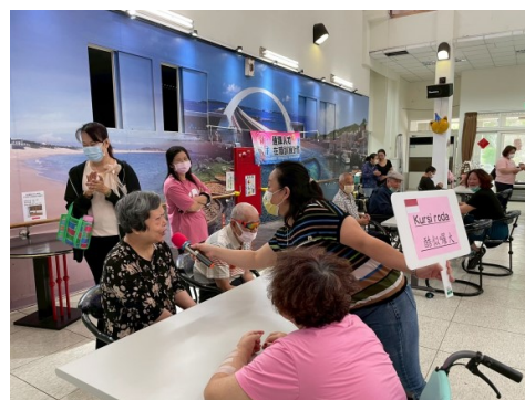
至老人之家進行外展活動，教導院生越南及印尼語，互動十分熱絡