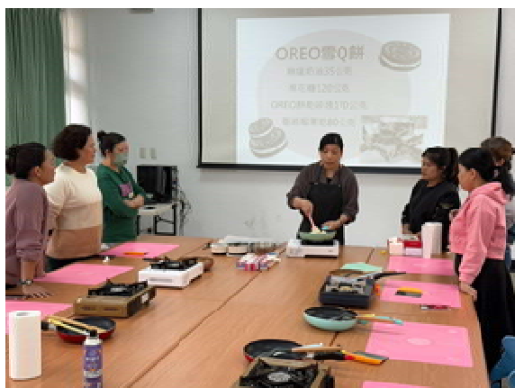
『新』光烘焙趣 活動計畫(第 1 場)～ 講師示範教學