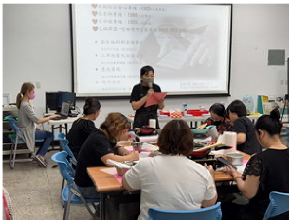
『新』光烘焙趣 活動計畫(第 3 場)～ 自傷防治宣導