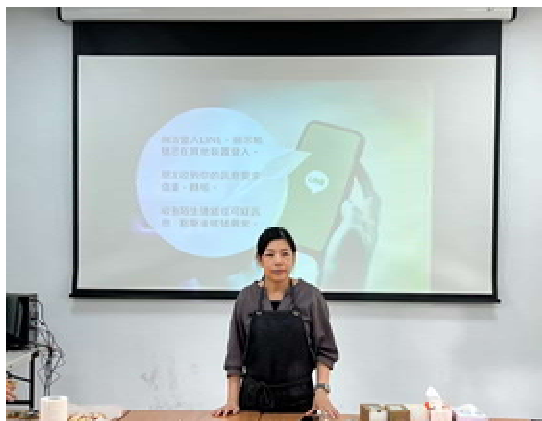
『新』光烘焙趣 活動計畫(第 1 場)～ 網路防詐騙宣導