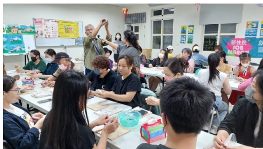
邀請專業師資教導陶藝製作技能