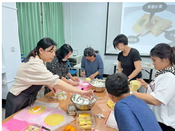
『新』光烘焙趣 活動計畫(第 2 場)～ 學員實際操作