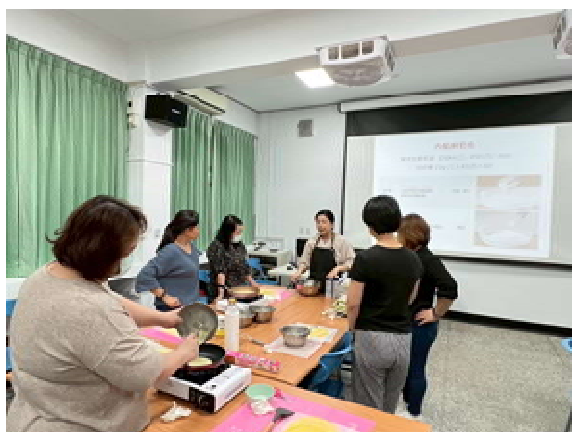
『新』光烘焙趣 活動計畫(第 2 場)～ 講師示範教學