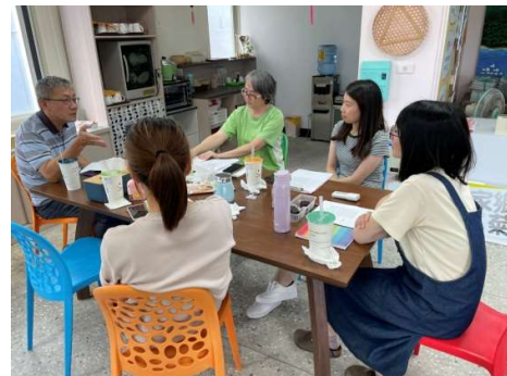
老師帶領進行議題討論