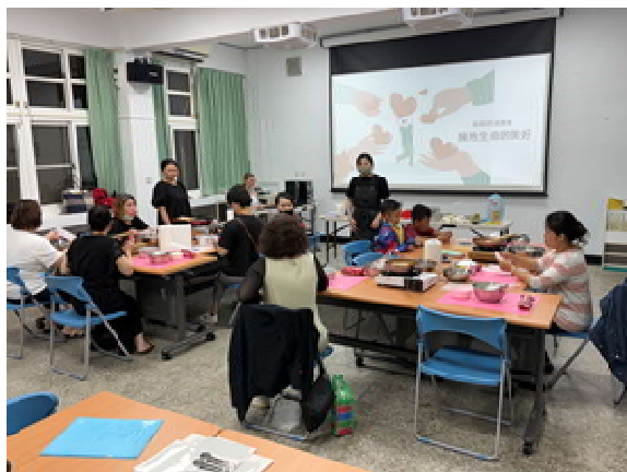
『新』光烘焙趣 活動計畫(第 3 場)～ 心理衛生宣導課程