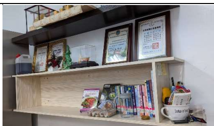
▲閱讀角落-小型巡迴書展