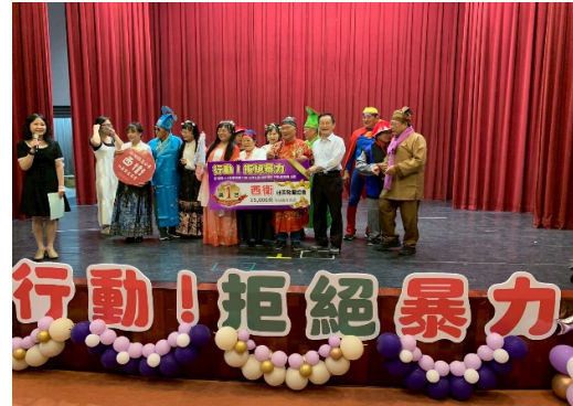
「行動！拒絕暴力」澎湖縣政府 114 年家庭暴力防治月社區初級預防行動劇競賽