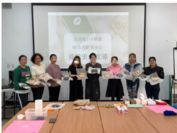
『新』光烘焙趣 活動計畫(第 1 場)～ 成果合照