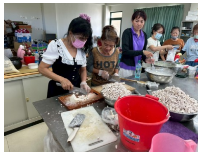
教導新住民製作在地傳統小吃-芋粿巧