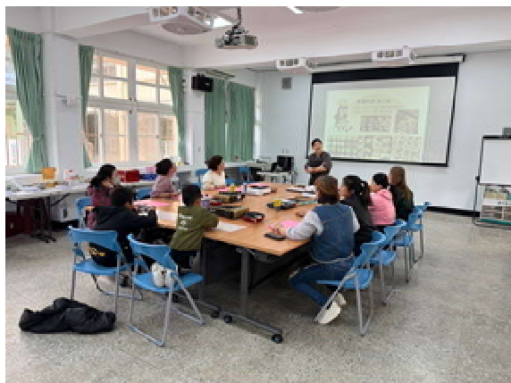
『新』光烘焙趣 活動計畫(第 1 場)～ 課程說明