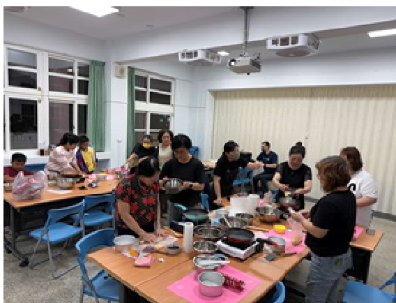
『新』光烘焙趣 活動計畫(第 3 場)～ 學員認真操作