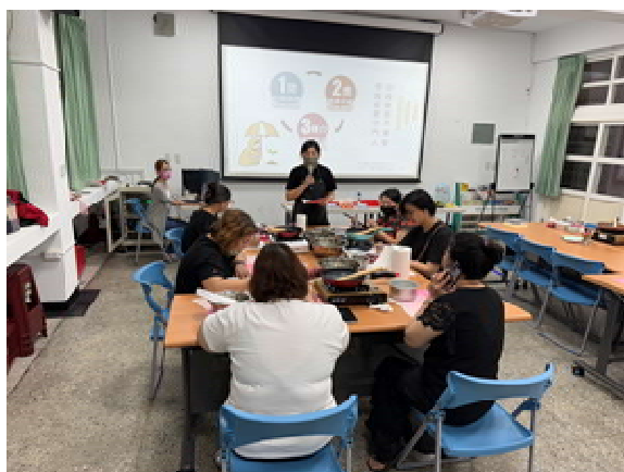
『新』光烘焙趣 活動計畫(第 3 場)～ 生命教育宣導