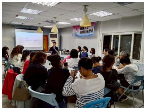
邀請陳立祥法官講授法律課程