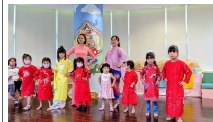
▲走秀時間-傳統服飾體驗