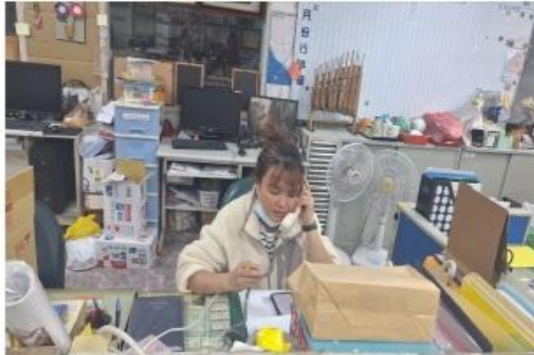
通譯進行文件說明