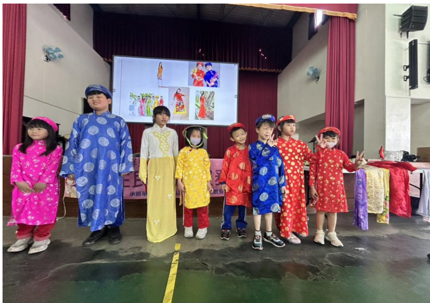
孩子們體驗多元文化，擴展文化視野從教育扎根