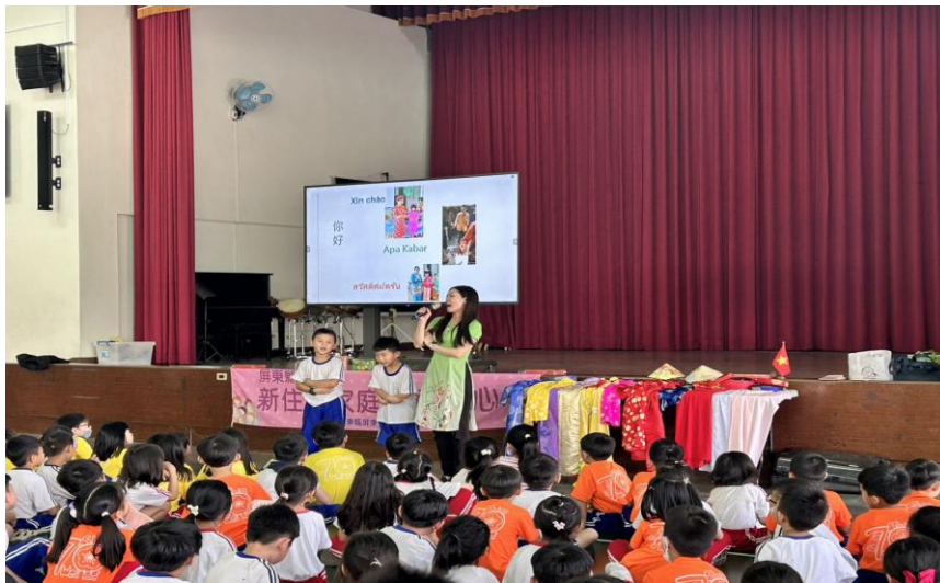
越南文化介紹~打招呼