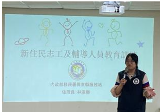
結合移民署服務站辦理活動