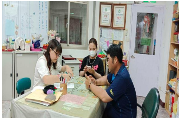
與律師會談，通譯在旁協助