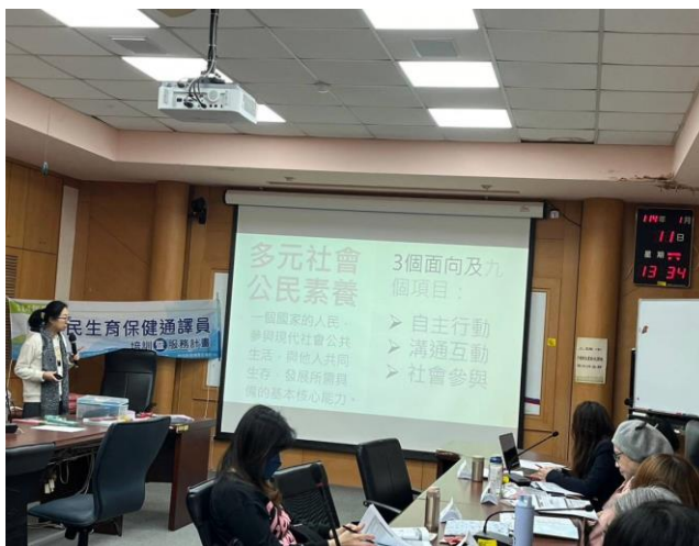
114/01/11 第 3 節主題: 通譯倫理，陳佳芬講師