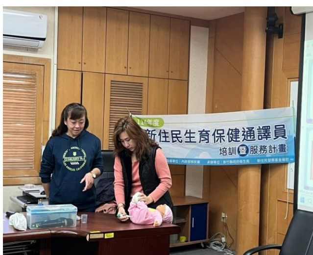
說明: 114/01/12 第 2 節主題: 嬰幼兒保健，