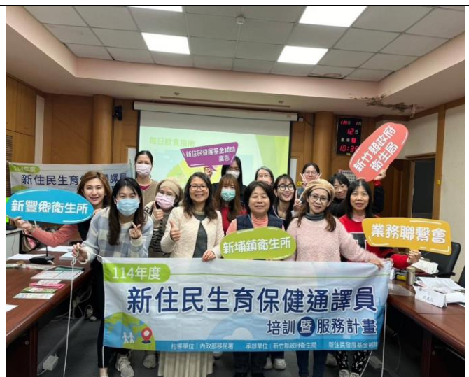
說明: 114/01/12 全體照(第 2 天)