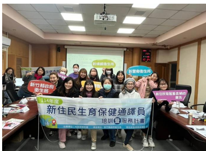
114/01/11 全體照(第 1 天)