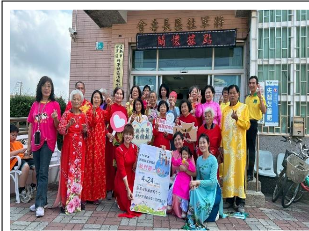
「我們是一家人」（將軍區將軍社區）