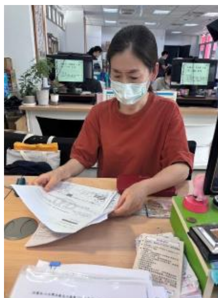
民眾至區公所洽詢社會福利等補助