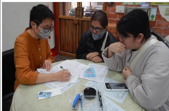
民眾至戶政事務所諮詢國籍歸化