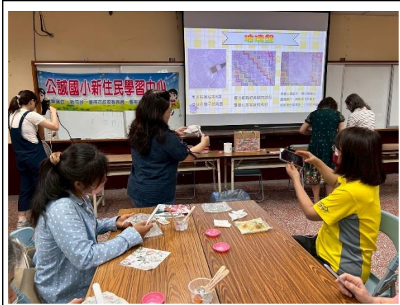
學校與社區特色多元文化學習活動

具體措施六： 結合地方政府與學校特色，於寒暑假辦理東南亞語言樂學計畫，鼓勵學生學習及體驗東南亞語文。