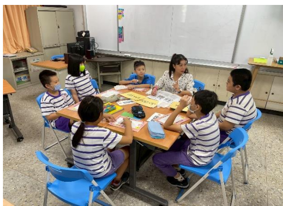
白河國小—介紹越南用語