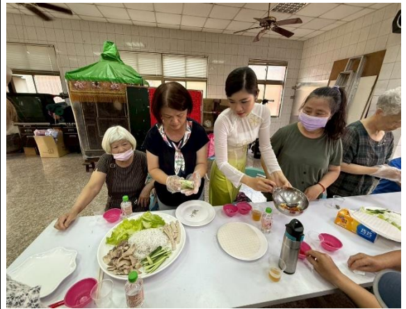
「我們是一家人」（關廟區松腳里社區）