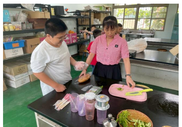
白河國小—製作越南法國麵包