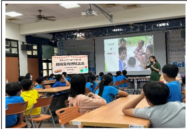
西門實小—介紹越南遊戲