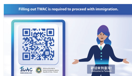
製作 TWAC 動畫影片 - 於網路及飛機上播放宣導

現行自動查驗通關系統 (e-Gate) 互惠國旅客，除須先註冊外，另須完成 TWAC 填報才可使用。未來將研議規劃互惠國旅客可比照國人，於 e-Gate 開道註冊及使用，預期將有更多外來旅客可享有 e-Gate 通關的便利性，為強化我國查驗通關效能措施預做準備。