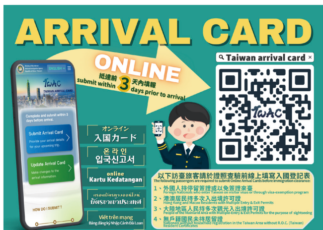
TWAC 需填報對象宣導圖卡

為因應世界趨勢，移民署於 113 年底即進行網路入國登記表網頁優化，並同時設計全新網頁，大幅提升系統功能，新網頁於本 (114) 年 5 月 5 日正式上線，移民署並於 10 月 1 日起全面推動網路填寫入國登記表 (TAIWAN ARRIVAL CARD，簡稱 TWAC) 新措施，來取代紙本入國登記表，此為重大變革，且對象為外來人口，推動過程實為不易。