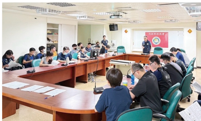
專案小組勤前教育

本案能夠順利偵破，正是檢警調與移民署長期合作的成果，也再次驗證了跨機關執法協調的重要性。為確保被害人相關權益，移民署與社福團體合作，除提供安置庇護外，亦主動協助渠等申請在臺居留、工作、就醫與翻譯等服務，讓被害人能在安全環境下逐步重建生活。