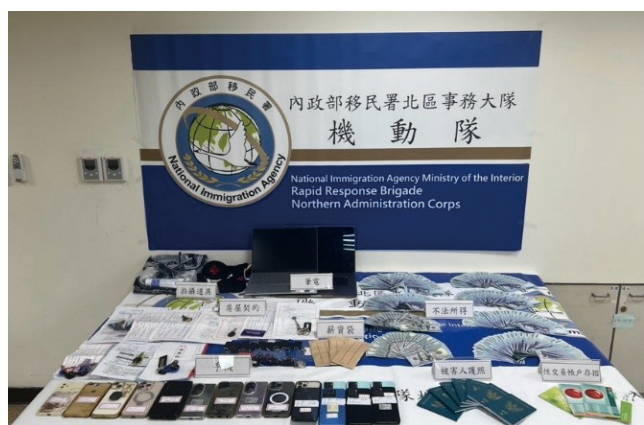
專案小組查扣之證物

移民署北區事務大隊機動隊在臺北地檢署指揮下，聯合臺北市警察局松山分局等單位，於今年 8 月間成功破獲跨國應召站集團。本案起源於一名印尼女子因病求助並不幸病重身亡，經專案小組耗時一年，鏗而不捨地抽絲剝繭，一步步揭露長期剝削實情。專案小組動員逾 50 名幹員，共查獲 10 名嫌犯與 20 多名外籍應召女子，並成功安置 6 名人口販運被害人。