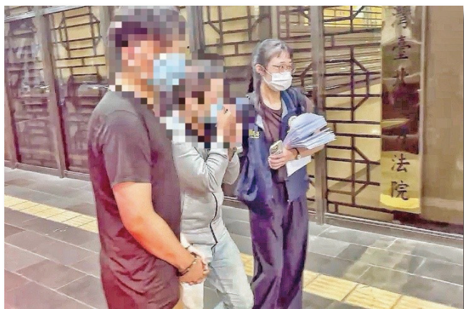
專案小組解送犯嫌至臺灣臺北地方檢察署

本次專案行動成果，共拘提逮捕 10 名集團成員，全案以《人口販運防制法》、《組織犯罪防制條例》及《刑法》妨害風化法移送臺北地檢署偵辦。其中主嫌 3 人因恐有串供滅證之虞，經檢方聲請羈押禁見獲准。本次專案同時也查獲泰國、越南及印尼籍等 20 餘名外籍女子，其中 6 人經移民署鑑別為人口販運被害人，已提供法律援助、心理輔導與醫療協助；其餘外籍應召女子則依規定辦理遣送返國程序。整起案件於 114 年 9 月 3 日由檢方以《人口販運防制法》、《組織犯罪防制條例》及《刑法》妨害風化法 3 罪，正式提起公訴，象徵政府在打擊跨國人口販運上再度取得重大成果。