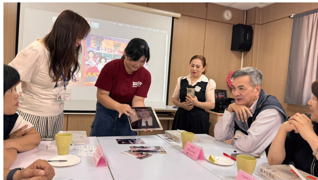
翁紅順女士（右 3）及女兒賴志惠小姐（左 3）運用 AI 方法將移民署副署長陳建成（右 2）當年的結婚照再次變得生動起來

辛苦又甜蜜的新婚時光。」他表示要將這個作品帶回家跟孩子們分享，一同重溫當時情景。