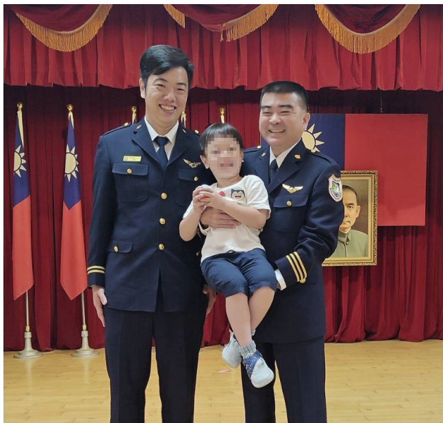
移民署署長林宏恩 (右 1) 親切地與本期學員林洋德 (左 1) 及其幼子合影留念

蒞臨的貴賓有內政部常務次長吳堂安、公務人員保障暨培訓委員會主任秘書廖慧全及臺灣警察專科學校主任秘書徐燕輝，移民署署長林宏恩率副署長陳建成、主任秘書林澤謙及各單位主管等，到場給予結業學員祝福，同時也邀請學員親友家屬共襄盛舉，林署長特地準備了鮮花，讓親友們能與學員合照，留住美麗且極具紀念性的時刻；其中有位學員的幼子到場，林署長除特地準備小玩具，更親切地與之合照，展現其威嚴以外，親切和藹的另一面。