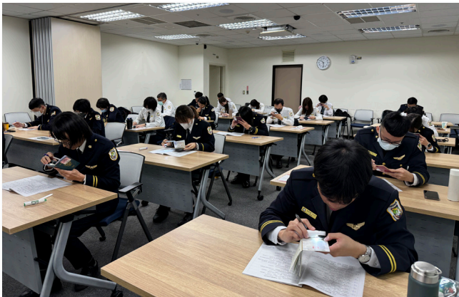
24 位菁英移民官齊聚桃園國際機場進行「證照辨識達人比賽」

移 民署國境事務大隊戍守我國國境大門並管控入出境人流，鎮守了全臺 10 座機場及 15 座港口。在 112 年 12 月 23 日這一天，來自全國各處駐地的 24 位菁英移民官，齊聚桃園國際機場第二航廈進行一年一度的「證照辨識達人比賽」專業組考試。這一場競賽匯聚了包含臺北松山、桃園、臺中及高雄 4 大國際機場以及基隆港、高雄港與離島金門的優秀移民官，不僅僅是為了選拔出辨識功力最為深厚的辨識達人，更是全面強化我國國門安全的重要活動。