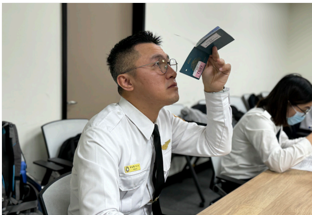
參賽移民官仔細檢查護照防偽設計，判斷是否有偽變造痕跡

本次的競賽出題方式包含了手機連線即時搶答、實體護照觀察分析及模擬設計護照防偽等多元化類型，目的在考驗移民官是否能透徹了解護照防偽設計及實務辨識技巧。其中實體護照題目取材自國境事務大隊歷年來實際查獲的偽（變）造護照案例，測試選手們能否在時限內以辨識工具判斷出證件真偽，並一一回答題目所列出各頁面的印製技術與防偽設計。要做到這一點，除了平常就需要隨時留意國內、外偽造證件的製作趨勢外，更要將日常所接受到的辨識專業訓練內化並加以實踐，才能在答題時做出迅速而精準的判斷。