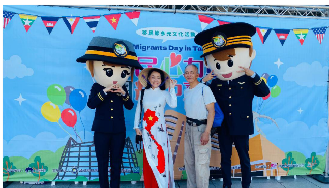
新住民身穿國服與家人一起歡慶移民節並與移民娃娃合影

睽違 5 年，移民節慶典活動再次回到陽光燦爛的中臺灣，移民署攜手臺中市政府及國立自然科學博物館於 112 年 12 月 10 日（星期日），在臺中市「國立自然科學博物館」舉行「移民心力量 閃耀中臺灣」多元文化活動。