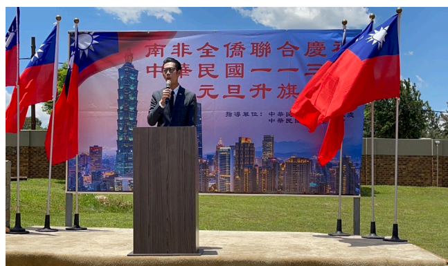
楊景翔移民秘書上臺宣導相關重要法令

活動結束後，本工作組收到眾多僑民熱情回饋，並於現場回應僑民對於本次入出國及移民法條文修正後之適用情形，如已成年之無戶籍國民，申請回臺定居之要件及辦理方式，依據入出國及移民法第 10 條第 3 項，申請人須於國外出生，持我國護照入國，出生時其父或母為居住臺灣地區設有戶籍國民，方符合定居要件。