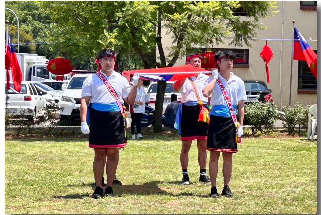
臺灣的原住民僑民青年們高舉國旗進場

廖文哲大使表示，在海外看到國旗飄揚並與僑民朋友們齊聚歡慶中華民國元旦，自己非常感動。隨後，廖文哲大使向在場的僑民朋友們述說著當前國內、外的政治、經濟發展情形，並提及中華民國建國 113 年以來克服多項挑戰，感謝各位始終團結並堅定地支持國家發展以及協助推動駐南非代表處各項業務。