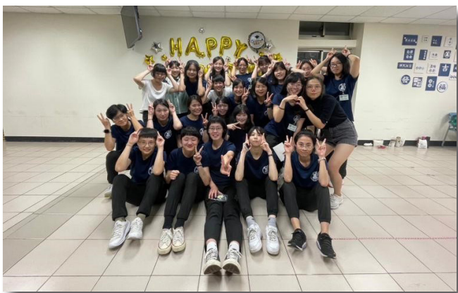
短期班結訓晚會中學員合影留念

接下來一連串的報到程序、整理行李、整理寢室床鋪、認識環境、學習生活常規、餐廳禮儀等活動，以及團體生活、按表操課的所有作息與課程，其實真的讓人一開始很不習慣，說穿了，是軍中生旅無誤。很多時候不只身體、行動、行為、言語受到限制，也有思緒、腦筋受到限制的時候，例如：集合點名時以及儀態訓練時，必須專心聽任何指令，一個腦袋神遊閃神了沒聽到，定將迎來一個大家不期待的眼神與關懷。但也都都知道，這些嚴格的訓練和要求是為了挺拔我們的儀態和強化我們的心志。古希臘哲學家亞里斯多德曾說：「每天反覆做的事情造就了我們，然後你會發現，優秀不是一種行為，而是一種習慣。」