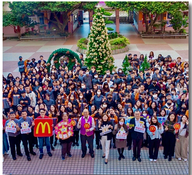
移民署攜手麥當勞前進學校關懷在臺僑生

為撫慰來臺就學僑生的思鄉心情及宣導相關規定，移民署臺北市服務站與「台灣麥當勞」合作，前往莊敬高職宣講移民法修正後居留在臺等重要資訊，並帶來新住民美食化解僑生思鄉之情，讓僑生們備感溫馨！移民署特別向學子說明「外國與外僑學生居留證線上申辦系統」操作方式及畢業後留臺等相關規定。另外也向僑生呼籲，這次移民法修法對於逾期者加重罰則，提醒學生們小心別逾期了。