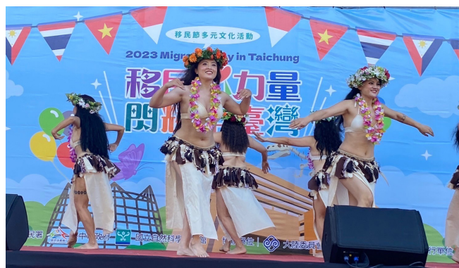
精彩的大溪地舞蹈

大溪地舞蹈是玻里尼西亞當地的傳統舞蹈，古時候是戰舞及祭祀與慶典的舞蹈，也是分享情感的舞蹈。團長與她的法國籍先生在臺灣共組家庭，盼望透過表演能讓臺灣人看到豐富世界文化；而印尼迎賓舞則是以印尼傳統舞蹈組合加上充滿活力、敏捷和迎接的動作，歡慶各國新住民來到臺灣，在表演團體中甚至加入了新二代團員的演出，顯示其文化傳承以及新二代所蘊含的豐富能量。