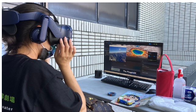
身歷其境的「VR 旅行體驗」，打開通往世界的任意門

值得一題的是，此次活動特別精心打造「科技體驗區」，引入身歷其境的「VR 旅行體驗」，利用 Google earth 3D 建模技術，打開通往世界景點的任意門，瞬間穿越到想去的地方；透過日益先進的便捷科技，讓民眾體會了日行千里，實現世界地球村。