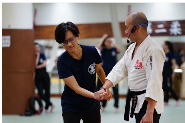
追捕逃逸失聯移工時的綜合逮捕技能

9個月的訓練，每日的課程都有令人耳目一新的感覺，在這裡的專業訓練是外面無法學到的。學科課程五花八門、包羅萬象，受邀的講師們皆為各業界或署內的頂尖優秀人才，從專業的講師身上，我們學到了有別於備考時法科嚴肅的應用理論，更多的是實務上活潑、切身的經驗之分享，增添我們更多的憧憬及期待，盼望下單位的那一天，將理論與實務結合，成為移民署得力的生力軍。